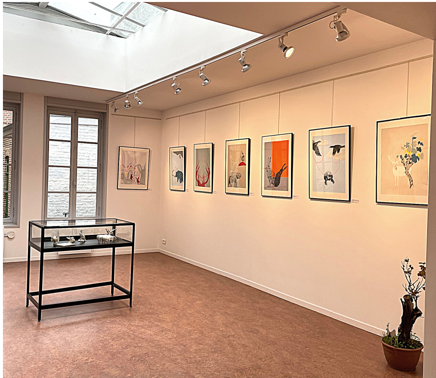
Vue de l'exposition Leïla Gaillard