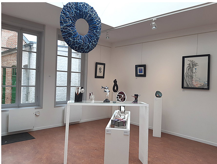
Vue de l'exposition Virginie Flahaut